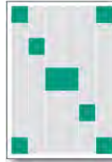
Treppen-Anzeige Satelliten-Anzeige Insel-Anzeige