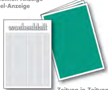
Zeitung in Zeitung Anzeigen-Strecke