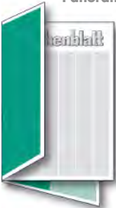
Flying Page / half cover